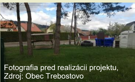
Fotografia pred realizáciou projektu

Ďalšie implementované projekty z PRV SR 2014 - 2022 nájdete v našej databáze!