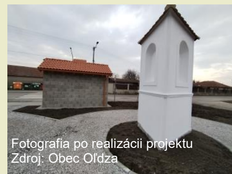
Fotografia po realizácii projektu