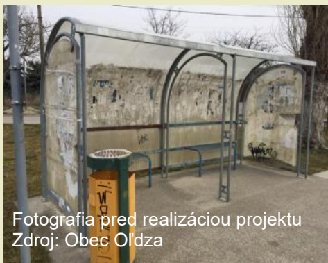
Fotografia pred realizáciou projektu