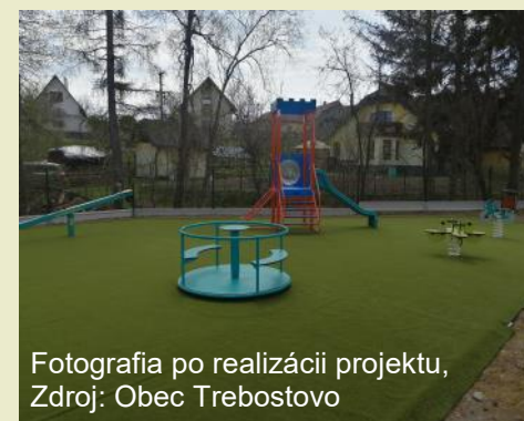
Fotografia po realizácii projektu

Rozšírenie a skvalitnenie voľnočasových aktivít obyvateľov obce Trebostovo bolo v súlade s aktivitou 1 - investícia súvisiaca s vytváraním podmienok pre trávenie voľného času vrátane príslušnej infraštruktúry.