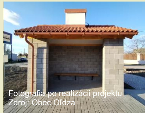
Fotografia po realizácii projektu

Cieľom obce bola výstavba novej zastávky busovej zastávky sa zvýšil celkovo komfort a na mieste zničenej pôvodnej autobusovej hlavne bezpečnosť zraniteľných účastníkov dopravy. zastávky zvýšiť bezpečnosť všetkých účastníkov cestnej premávky, prispieť k oživeniu vidieckej oblasti, tak aj prispieť k ekonomickému rozvoju obce. Projekt bol riešený v prospech všetkých obyvateľov obce. Vybudovanie autobusovej zastávky prispelo k rastu kvality života obyvateľov i k zlepšeniu celkového vzhľadu obce. Výstavbou auto-