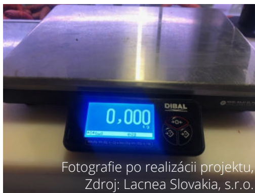
Fotografie po realizácii projektu

Pre naplnenie cieľov projektu sú jeho predmetom investície do nákupu technológie výroby mäsa a mäsových výrobkov a investície do zlepšenia logistiky a informatiky. Predkladaný projekt nadväzuje na predchádzajúce investičné projekty, zodpovedá cieľom podniku a cieľom opatrenia a vytvára predpoklad pre riešenie nadväzujúcich projektov.