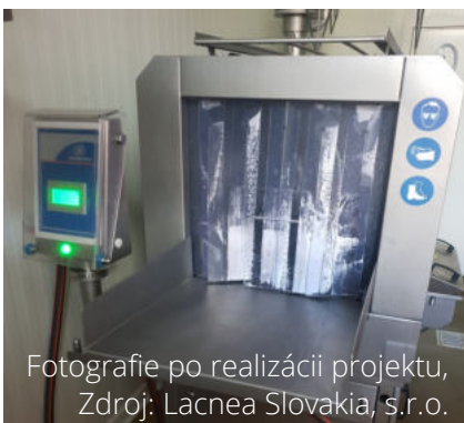
Fotografie po realizácii projektu

Schválená výška príspevku z PRV SR 2014 - 2020 : 92 290,91 €