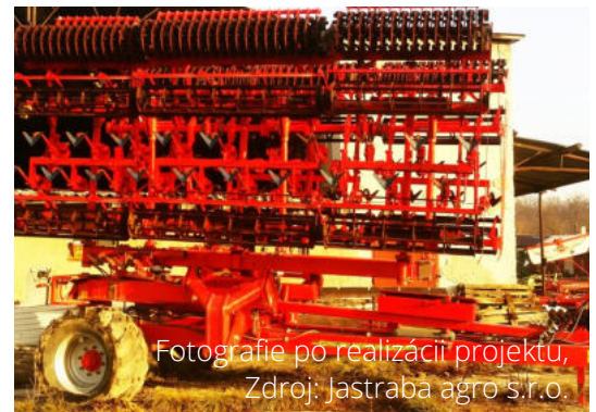
Fotografie po realizácii projektu, Zdroj: Jastraba agro s.r.o.