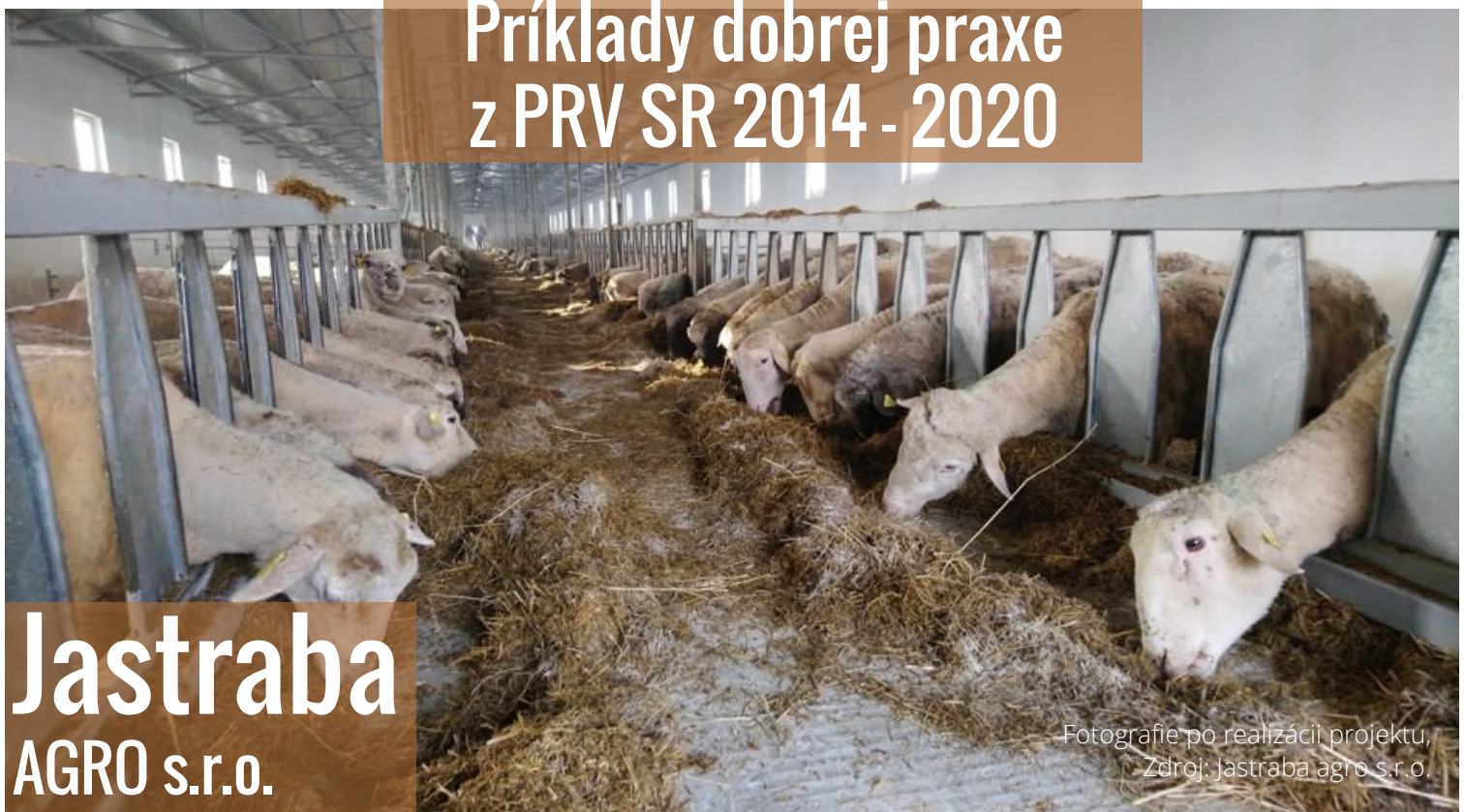
Fotografie po realizácii projektu