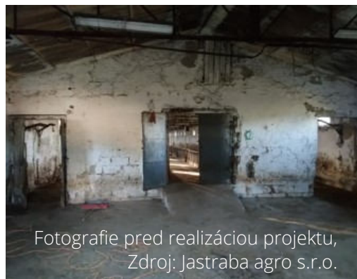
Fotografie pred realizáciou projektu, Zdroj: Jastraba agro s.r.o.