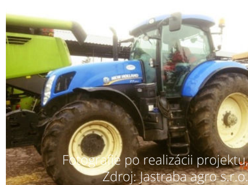
Fotografie po realizácii projektu