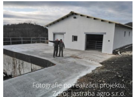
Fotografie po realizácii projektu, Zdroj: Jastraba agro s.r.o.