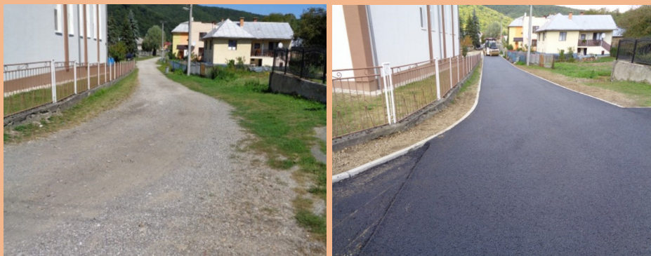
Fotografia pred a po realizácii projektu

Viac informácií o danom projekte nájdete na: http://www.nsrv.sk/databaza-registracnych-formularov-prvsr-2014-2020?id=658