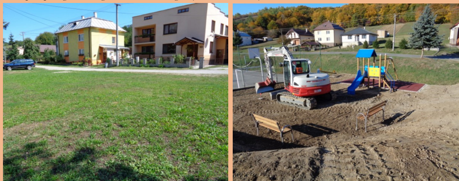
Fotografia pred a po realizácii projektu