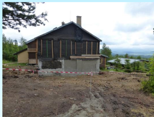
Fotografia pred realizáciou projektu; Zdroj: Ing. Vladimír Očvár – PRODOLES

Predmetom projektu je výstavba nového 6 lôžkového ubytovacieho zariadenia s relaxačnými činnosťami, ktoré je v krásnom prírodnom prostredí prístupné pre návštevníkov. Primárnym cieľom je diverzifikácia podnikateľskej činnosti o poskytovanie ubytovacích služieb bez pohostinských činností, v oblasti vidieckeho cestovného ruchu, vybudovaním ubytovacieho zariadenia s možnosťou rekreačných a relaxačných činností.